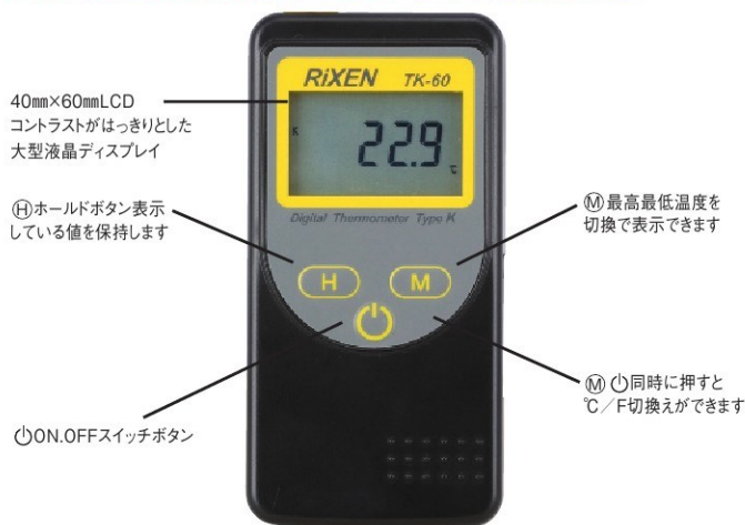
K熱電対センサ各種 P.118~121