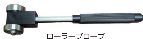
ローラープローブ